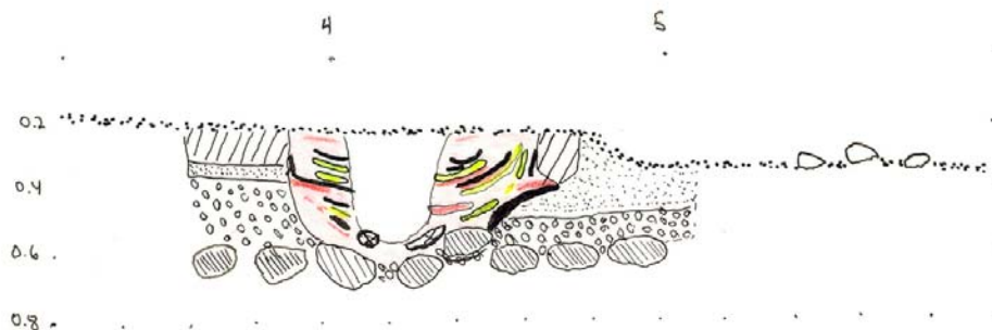
Mynd 4. Sniðteikning af gröfnni. Í sniðinu sést að grafnn hefur verið hola í miðja gröfnn, alveg niður að beinagrindinni. Gular rendur tákna grágræna gjóska í torfi. Svartar rákir tákna svarta gjósku. Rauðar rendur sýna dökkbrúna mold í torfi. Neðst, undir gröfnni er hraungrjót; ljós Heklu vikur þar ofan á og síðan sandur. Í yfirborði er þunnt lag af svörtum vikri. Teikn. G.Ó.

Höfuðkúpan lá í suðaustur horni grafarinnar, brotin í nokkra hluta þegar að var komið. Stærsti hlutinn hafði fundist á yfirborði. Útlínur grafarinnar bentu til þess að hún hafi verið um 160 - 180 cm að lengd og 66 cm breið til fóta, og um 60 cm breið við axlir. Þegar byrjað var að grafa niður, sást að gröfnn hafði verið grafin niður á hraunið sem þarna er undir öllu, og að hún var dýpst um miðjuna. Grynna var niður á hraunið við höfða- og fóttagafl. Þetta hafði valdið því, að höfuðkúpan stóð upp úr og hælbein beinagrindarinnar kom í ljós aðeins 5 cm undir yfirborði.