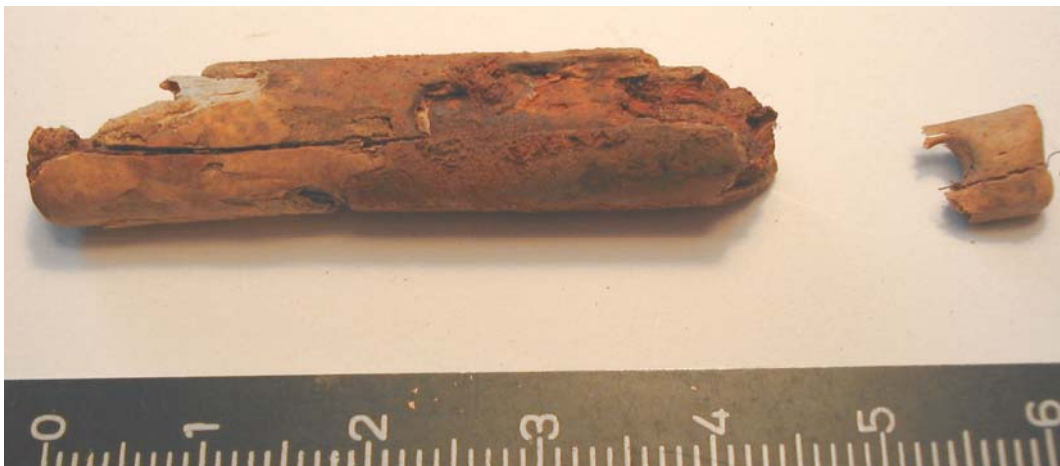
Hnífsskaft úr beini (F-2). Hnúður á enda tangans sést koma út úr skaftinu lengst til vinstri. Óvíst er hvort litla stykkið til hægri tilheyrir skaftinu. (GÓL 2005).

F. 1. Einhliða kambur úr beini. Um 8 - 10 brot. Okið hefur verið negldur með a.m.k. 11 hnoðnöglum. Hann er um 0,8 cm breiður við endann og er breiðastur um 1,1 cm. Endahlutinn er 2,2 cm breiður, en allar tennur eru brotnar úr millistykkinum.