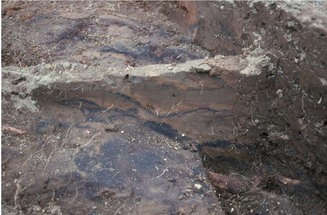
Horft til vesturs á hluta þversniðs sem sýnir torf sem lagt hefur verið yfir gröfina. (GÓL 1989-6-2).