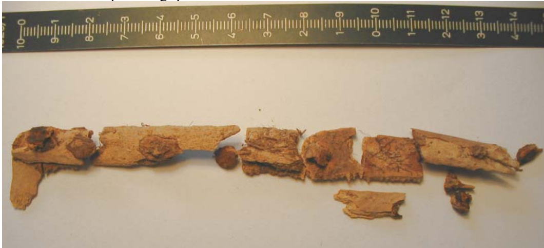
Brotum úr kambi raðað saman (F-1). (GÓL 2005).

Allar jarðvegsleifar úr sýninu voru sigtaðar og öllum beinaögnum sem hugsanlega gátu hafa verið brot úr þessum gripum var safnað saman.