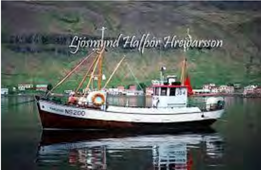
Auðbjörg NS 200 á floti.