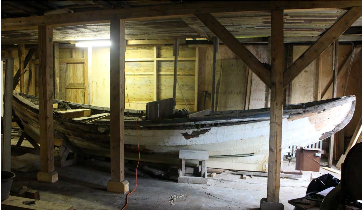
Guðrún Helga SU 25.