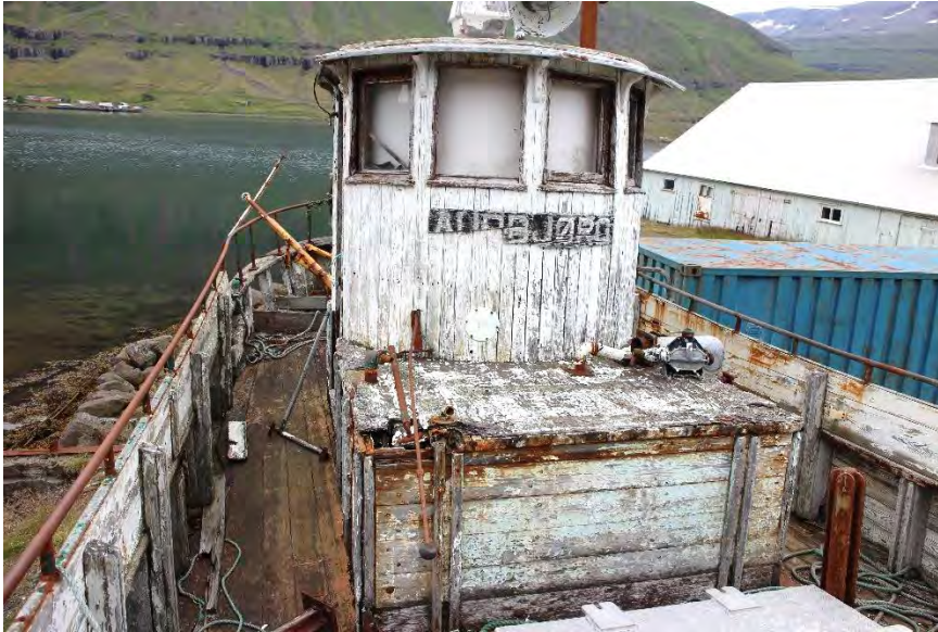
Auðbjörg NS 200, stýrishús og vélarúm.