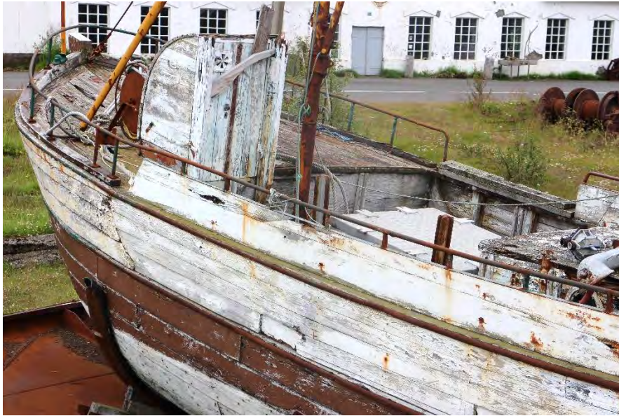
Auðbjörg NS 200, framdekk og stefni.