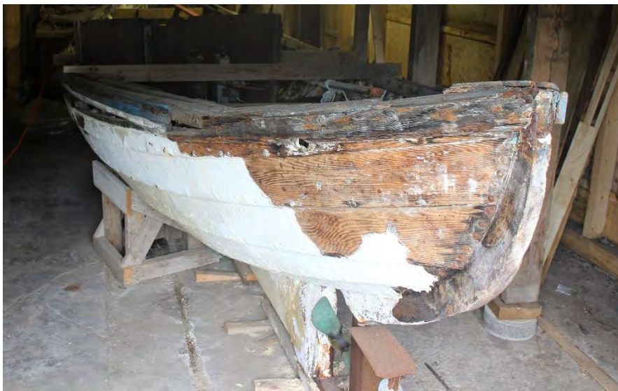
Guðrún Helga SU, skuturinn. Sett hafði verið á hann plastkvoða, fyrir sennilega 30 árum eða svo, sem reyndist vel en er farin að flagna eins og sjá má.