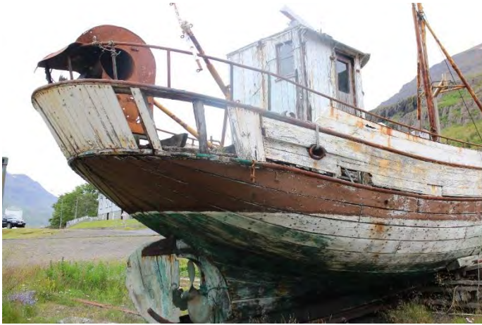
Auðbjörg NS 200, skutur.