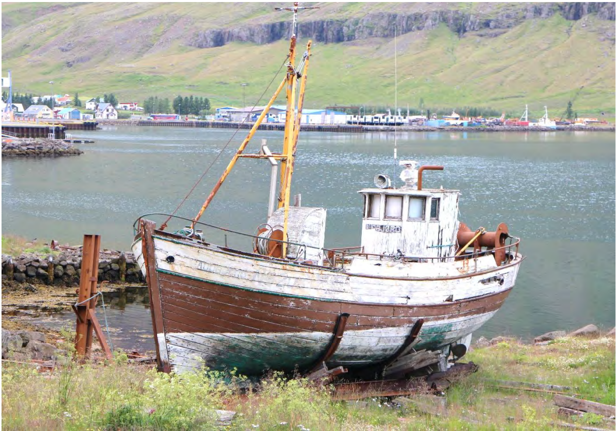
Auðbjörg NS 200 í slippnum á Seyðisfirði. Myndirnar eru teknar með árs millibili.