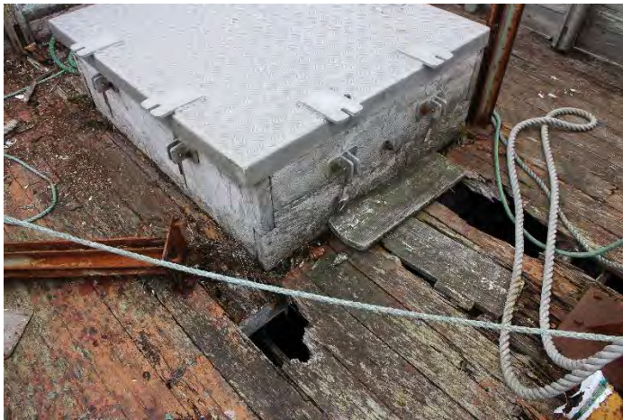
Auðbjörg NS 200. Fúi í miðdekki.

Nær ekkert viðhald hefur farið fram á bátnum síðustu 20 árin. Menn í bænum munu hafa boðist til að skrapa hann og mála. En safnstjóri Tækniminjasafnsins hafi verið því mótfallinn. Hann hafi viljað fá fyrst úr því skorið hvort bátinn ætti að gera sjófæran, hvort hann ætti að vera á þurru landi, snyrtilegur, úti eða inni. Hann hefur sótt oft en einu sinni um styrk til Fornleifasjóðs til að gera úttekt á bátnum en fengið neitun. Safnstjórinn telur að ekkert sé nú heilt í bátnum nema eikin, skelin. Það sé líka verðmætast. Hann hafi á sínum tíma tekið við bátnum af því að hann hafi ekki verið mjög gamall. Þá hafi verið meira heilt í honum. En það virtist vinna gegn honum við styrkveitingar. Sænskur maður sem kom til bæjarins og leit á bátinn mælti eindregið með að tróðið væri tekið úr byrðingnum. Og tók að sér að gera það. 12