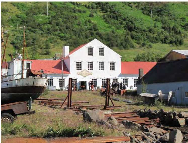
Slippurinn á Seyðisfirði. Hvíta húsið fyrir miðri mynd er Vélsmiðja Jóhanns Hanssonar. Á vinstri hönd sést í Auðbjörgu NS 200.