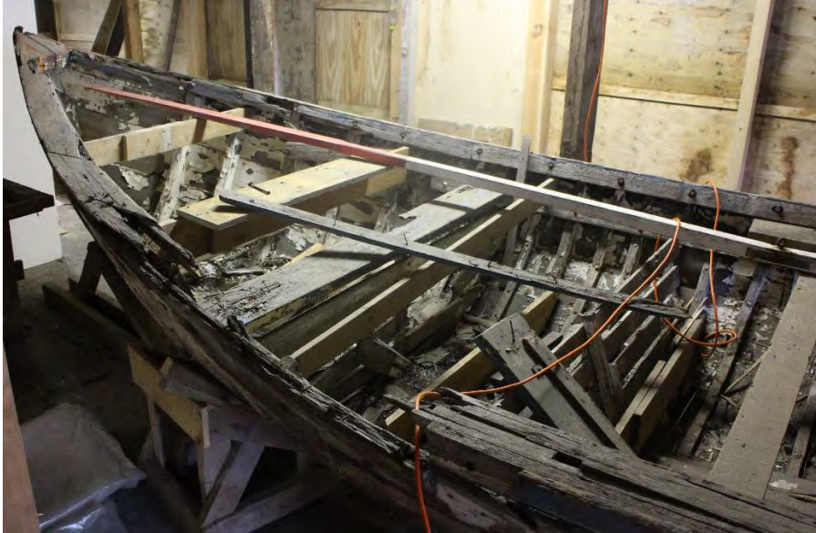
Guðrún Helga SU. Borðstokkur og byrðingur eru brotnir eftir að báturinn f auk.

Viðhald á bátnum hefur verið lítið síðustu 30 árin. Hins vegar hefur hann orðið fyrir ýmsum skakkaföllum og ekki verið lagfærður á eftir. Hann nýtur sennilega góðs af því að einhvern tíma var borin á hann plastkvoða sem komið hefur í veg fyrir fúa í byrðingnum að miklu leyti.