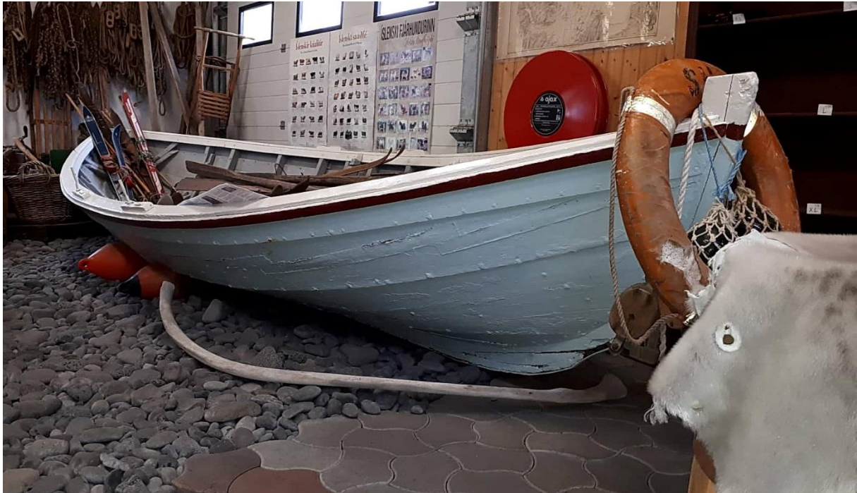
Sjektan á sýningu í Bjarnarhöfn 2018.